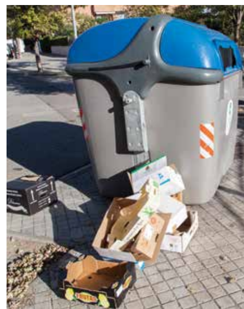
Caixes fora del contenidor al barri de les Comes.

Per això l'entorn comercial, per on es mou i compra el client potencial, ha de ser analitzat i tractat amb cura. És important garantir una oferta variada que combini serveis i productes de primera necessitat en uns espais amb voreres amples per passejar. Les papereses i contenidors han de ser nombrosos i afavorir una recollida selectiva eficient. L'arbrat ha d'estar convenientment esporgat perquè les branques no entorpeixin el pas ni prenguin visibilitat als comerços i els escocells han de ser reomplerts amb regularitat. La