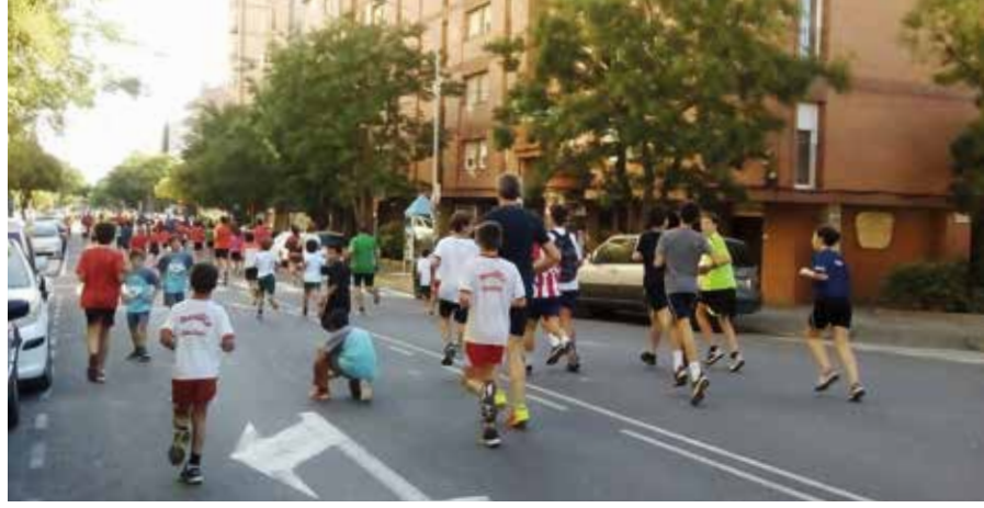
Avinguda Barcelons.