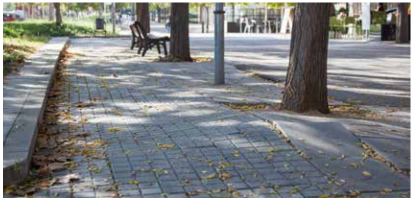
Voreres en mal estat al C/ Bellprat i a l'Av/ Països Catalans de les Comes.