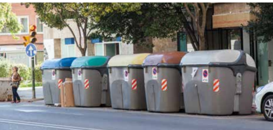
Contenidors de recollida selectiva a l'Avinguda Barcelona.