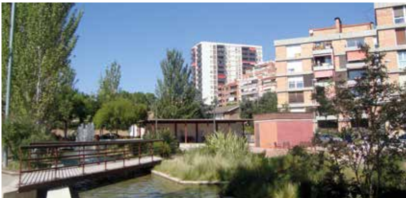
Parc García Fossas.