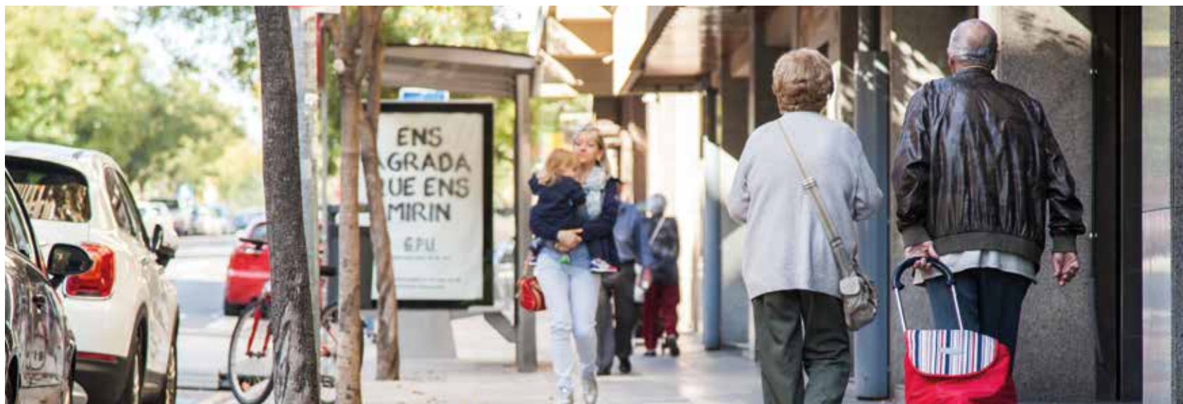
Zona Comercial Igualada Nord.

El comerç local, com a comerç de proximitat no ha de lluitar per competir amb empreses logístiques ni botigues online on el que prima és el preu. La venda directa, l'atenció personalitzada i el coneixement mutu és el toc diferencial del comerç de proximitat. Tot i això, sí que és veritat que l'evolució del comerç fa que les botigues també hagin d'adaptar-se però sobretot, cap a crear xarxes i sinèrgies entre elles. Com se sol dir "la unió fa la força" i en aquest cas és importantíssima per potenciar i dinamitzar la feina dels ens locals.