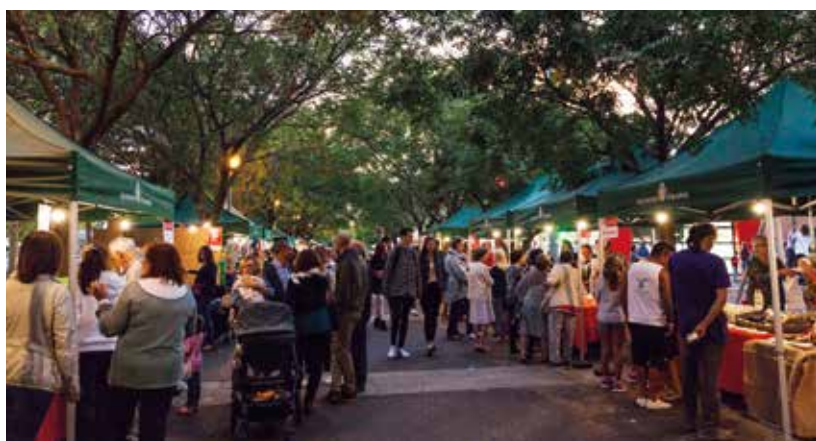
Festival Naturveg 2017